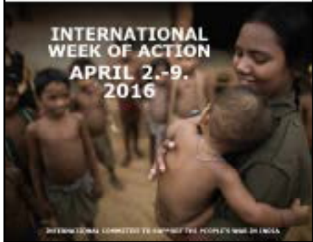
INTERNATIONAL COMMITTEE TO SUPPORT THE PEOPLE'S WAR IN INDIA

UNCONDITIONAL FREEDOM FOR ALL POLITICAL PRISONERS IN INDIA SOLIDARITY WITH ALL POLITICAL PRISONERS IN THE WORLD STOP OPERATION GREEN HUNT, STOP THE WAR AND AERIAL ATTACKS ON THE PEOPLE SUPPORT THE PEOPLE'S WAR IN INDIA